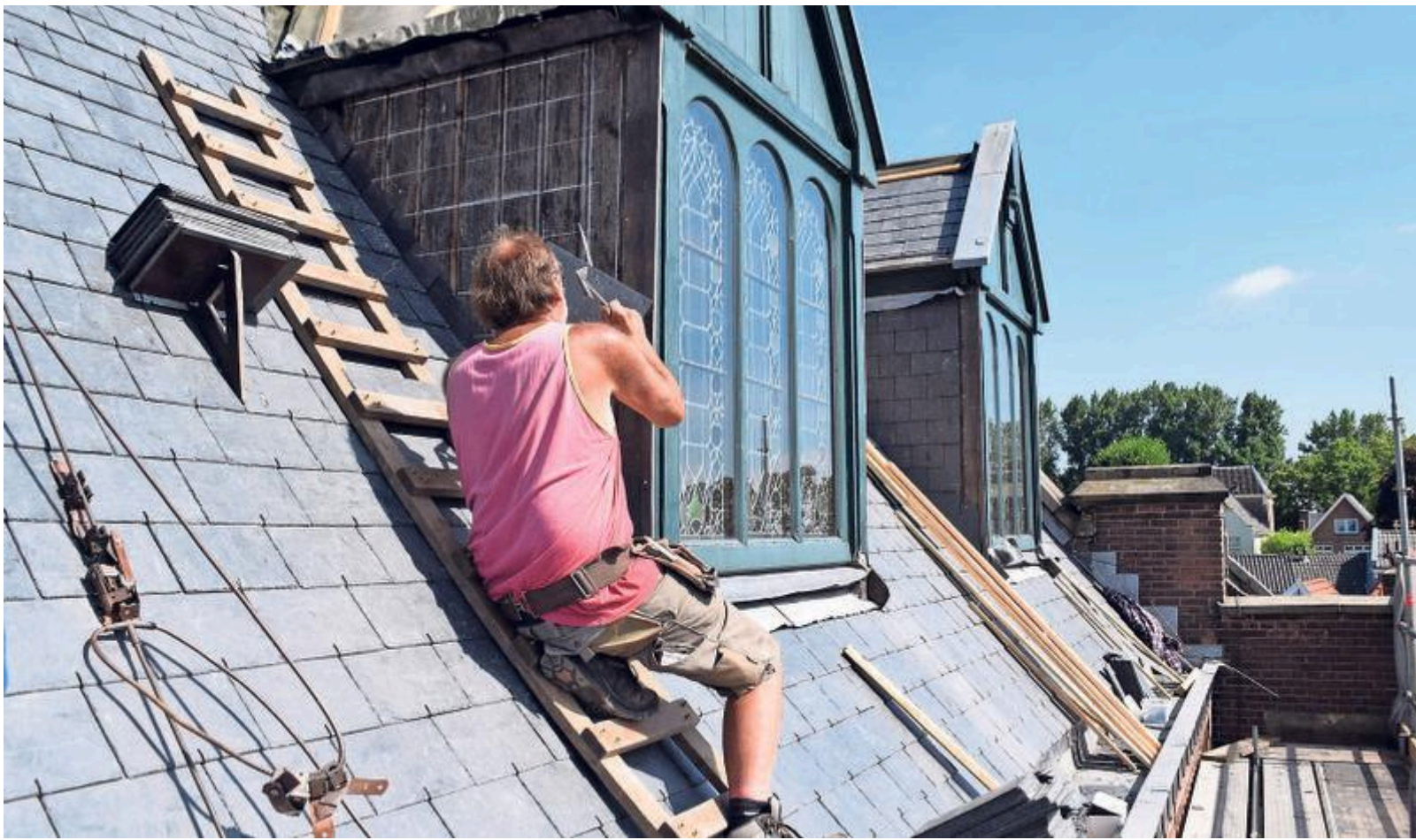
De dakbedekking van de Van Houtenkerk is binnen 3,5 maand in zijn geheel vervangen..