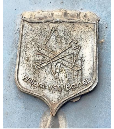
Trotseerloodje van Willem van Boxtel.